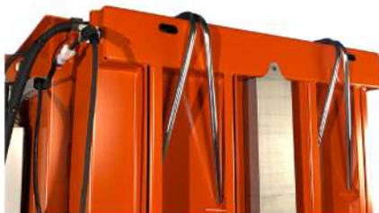
Tuyaux pour un liage facile de la balle