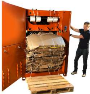
Appuyez simplement sur deux boutons pour éjecter la balle

Cette presse est rapide avec son cycle de 16 secondes seulement. Grâce à la fonction de série de démarrage automatique, elle est rapidement opérationnelle pour le chargement de carton ou plastique. La 3220 peut s'activer manuellement mais il est préférable de la faire fonctionner en mode automatique pour une meilleure productivité et une meilleure commodité.