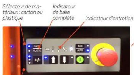
Taille de balle réglable

Les balles pèsent jusque 150 kg et sont facilement éjectées grâce à une fonction semi-automatique.